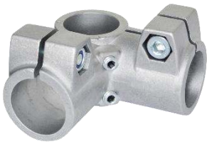
Noix de serra d'angle