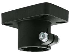
Embout de tube technopolymère