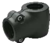
Noix de serrage en T