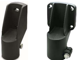
Embout de tube technopolymère