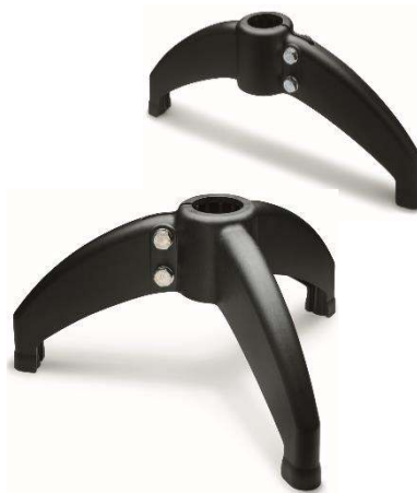
Support à deux ou trois appuis