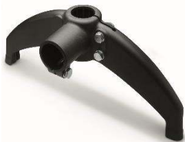
Support avec renvoi, à deux appuis